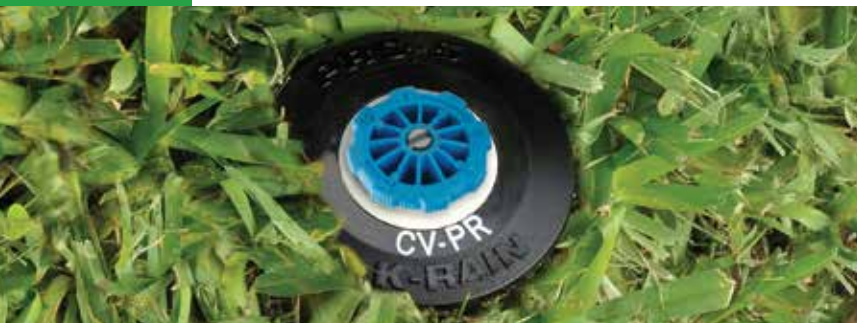
CV-PR impreso (opcional, mostrado arriba) es fácilmente identificado después de la instalación.

Los difusores PRO-S™ se construyen tomando en cuenta al contratista profesional. Su junta autolimpiable remodelada, asegura un máximo rendimiento a través del tiempo, incluso a baja presión.